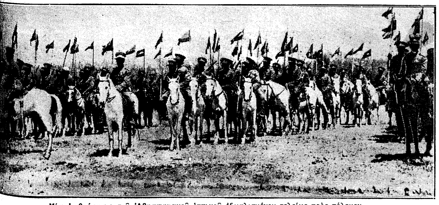
Μία ἐπιθεώρησις τοῦ Ἀβησσυνιακοῦ ἰππικοῦ ἐξοπλισμένου τελείως πρὸς πόλεμον