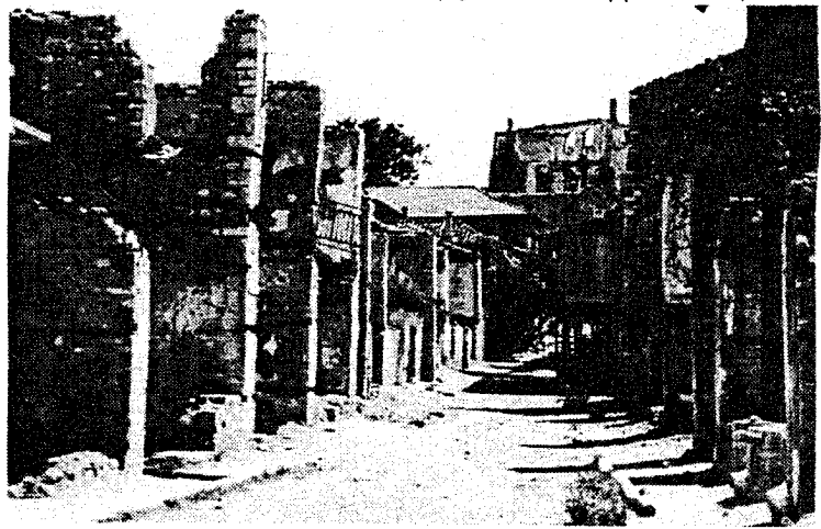
Ο δρόμος της αγοράς μετά το ολοκαύτωμα

"Φτού σου, αγριάνθρωπε. Που είναι, κανίβαλε, η στρατιωτική σου τιμή; Όλοι σας είσατε κτήνη, βάρβαροι, μογγόλοι. Φτού σας γουρούνια". Δε πρόλαβε να