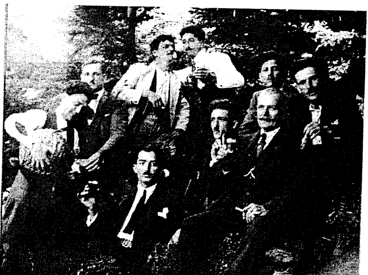
Οι Άνδρες Καλαβρυτινοί γλεντούσαν και χαιρόνταν τη ζωή. Ο ψυχρός ναζί του σκυθρωπού θορρά, δεν το συγχώρεσε αυτό!

Στρατιωτικός αρχηγός του ήταν ο "Σφακιανός" - Γεώργιος Αρετάκης, Καπετάνιος, ο Καπετάν Δήμος και πολιτικός καθοδηγητής "ο Βελάδης" - Γιάννης Κα-