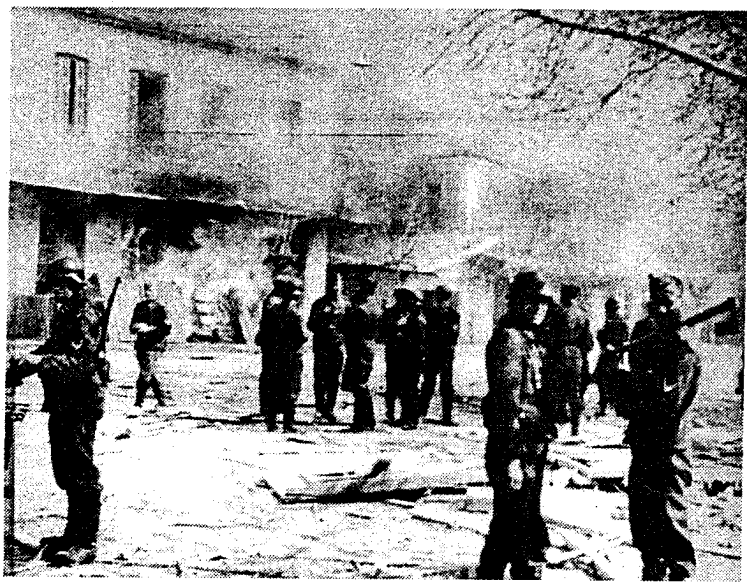
Στρατιώτες του Χίτλερ καταστρέφουν και πυρπολούν τα Καλάβρυτα

ζεστή η μέρα κείνη, πνιγμένη στη κουφάβραση με καταχνιά και χαμηλή ομίχλη, που σαν ολόλευκο αδιάφανο σάβανο, σ' εμπόδιζε να διακρίνεις άνθρωπο πέρα από πέντε μέτρα.