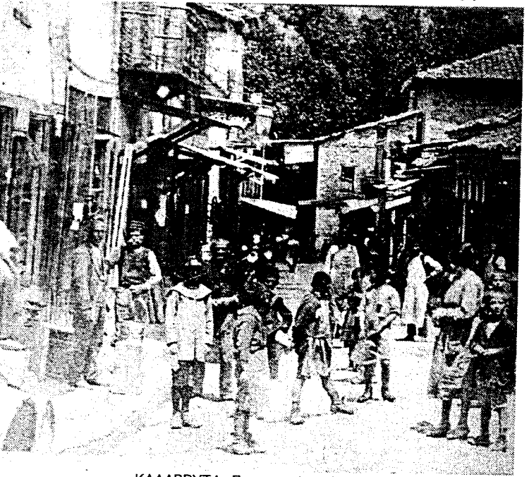
ΚΑΛΑΒΡΥΤΑ: Πριν το ολοκαύτωμα

Παρέδωσαν τους αιχμαλώτους και τους τραυματίες στις τοπικές οργανώσεις και οι ίδιοι έφυγαν ξανά, ενθουσιασμένοι από το κατόρθωμά τους, για να το