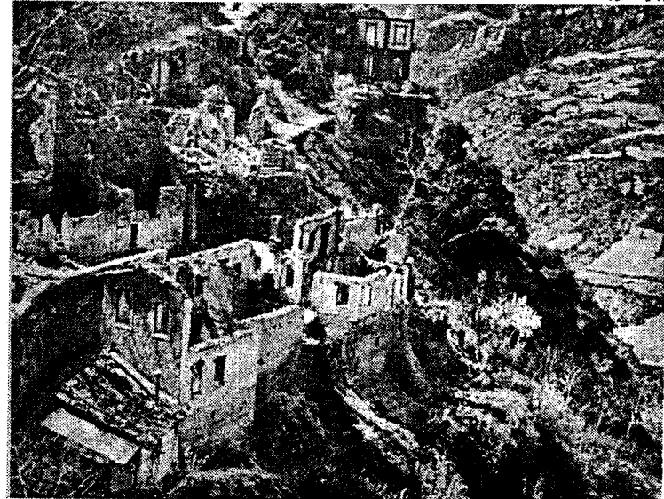
Οι ναζι δε σεβάστηκαν ούτε μοναστήρια. Αδιάφειστος μάρτυρας: κατεστραμμένη η Ιερα Μονή του Μεγάλου Σπηλαίου

'Όλα αυτά, μαζί με τις ξέπνες σιμωγές αυτών που αργοπεθαίνουν, συνθέ-